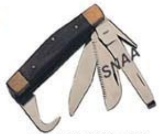
Castrating Knives Set